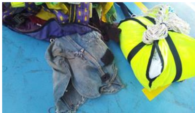
Rifľový vak záchranného padáka